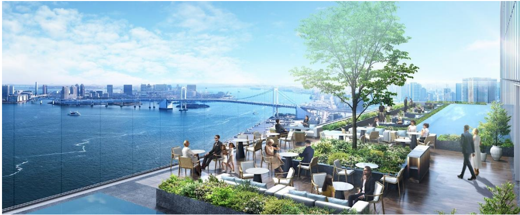
「フェアモント東京」35階の屋外テラスイメージ（東京湾側）

「フェアモント東京」は、東京湾のほとりに位置し、東にはレインボーブリッジ、西には東京タワーを望む絶好のロケーションです。都心の活気と湾岸の静けさが見事に調和するこの空間は、訪れるすべての方々に、非日常のエlegantな体験を提供します。館内には、29のスイートを含む217の客室、エグゼクティブラウンジ、5つのレストランと2つのバー、4つの屋外テラス、スカイチャペル、スカイベンケット、グランドボールルーム、スパ、シグネチャーインフィニティプール、屋外リラクゼーションプール、フィットネス施設を完備します。インテリアデザインは、メルボルンを拠点とし、国際的に高い評価を受けるデザインスタジオ「Bar Studio」が手がけ、地域性を反映したエlegantでコンテンポラリーなデザインを施しています。