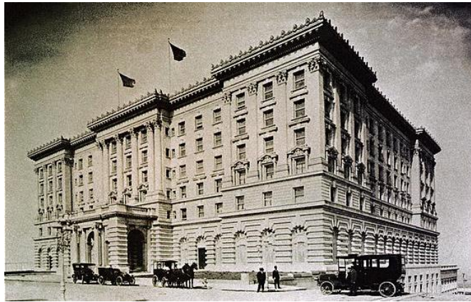
1907年に開業したフェアモント サンフランシスコ

フェアモントホテルは、1907年に開業したフェアモント サンフランシスコを皮切りに、世界中でその名を広めてきました。その歴史は、カナダ太平洋鉄道の建設を指揮したウィリアム・コーネリアス・ヴァンホーンのビジョン「風景を輸出できないなら、観光客を輸入しよう」のもと始まり、1888年にバンフ スプリングス ホテル（カナダ）を開業し、壮大な自然の魅力の世界中の旅行者に提供しました。その後、ネバダ州上院議員であり銀鉱山の億万長者であったジェームズ・グラハム・フェアの娘たちが、父の名を冠したホテルを建設することを決意し、1907年にフェアモント サンフランシスコが誕生しました。