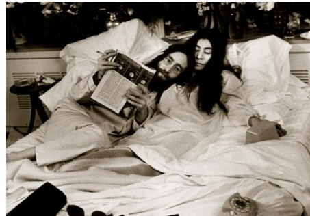
フェアモント ザクイーン エリザベスでの「ベッドイン」

1945年にはフェアモント サンフランシスコで、国連憲章に50か国が署名し、世界平和の礎が築かれた歴史的な場所としてその名を刻みました。また1969年にはフェアモント ザクイーン エリザベス（カナダ・モントリオール）で、ビートルズのジョン・レノンとオノ・ヨーコが「ベッドイン」を行い、世界中に平和のメッセージが発信されました。