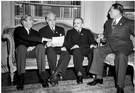
フェアモント サンフランシスコでの国連憲章署名

フェアモントホテルは、1907年に開業したフェアモント サンフランシスコを皮切りに、世界中でその名を広めてきました。その歴史は、カナダ太平洋鉄道の建設を指揮したウィリアム・コーネリアス・ヴァンホーンのビジョン「風景を輸出できないなら、観光客を輸入しよう」のもと始まり、1888年にバンフ スプリングス ホテル（カナダ）を開業し、壮大な自然の魅力の世界中の旅行者に提供しました。その後、ネバダ州上院議員であり銀鉱山の億万長者であったジェームズ・グラハム・フェアの娘たちが、父の名を冠したホテルを建設することを決意し、1907年にフェアモント サンフランシスコが誕生しました。