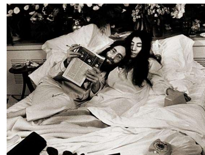
1969年：平和のための「ベッド・イン」

「フェアモント」は、魅力あふれるロケーションでその土地ならではの体験をお届けすること、極上のサービスを提供することに専心し、皆さまのお越しを心よりお待ちしております。時代を超えたエレガンスと最高水準のサービスで、生涯の思い出に残るようなひとときをお届けいたします。