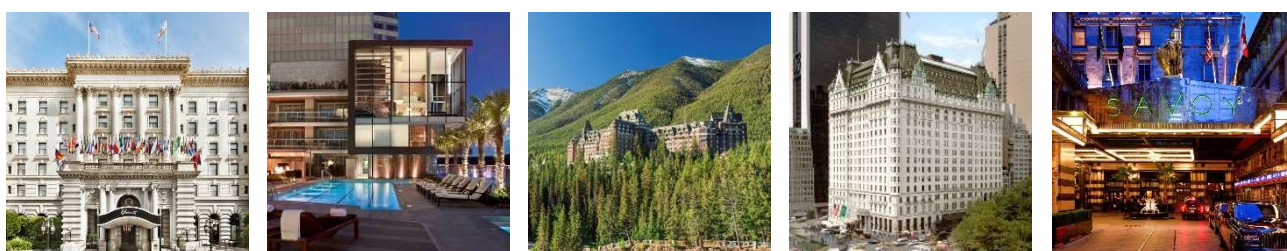
「フェアモント サンフランシスコ」 「フェアモント パシフィックリム」 「フェアモント バンフ スプリングス」 「ザ プラザ ニューヨーク」 「ザ サボイ ロンドン」

「フェアモント」の各ホテルは歴史的なイベントでも大きな役割を果たしてきました。1943年には、「フェアモント ル シャトー モンテペロ」にて、ウィリアム・ライアン・マッケンジー・キング加首相と、ノルマンディ上陸作戦の計画を策定していたウィンストン・チャーチル英首相およびフランクリン・ルーズベルト米大統領による第1回ケベック会談が行われました。1945年には、「フェアモント サンフランシスコ」のガーデン ルームで国連憲章がまとめられ、50ヶ国が署名しました。モントリオールの「フェアモント ザ クイーン エリザベス」にて、ビートルズの元メンバー、ジョン・レノンとオノ・ヨーコが歴史的な平和のための「ベッド・イン」のパフォーマンスを行ったのは1969年。反戦運動のテーマ曲となった「Give Peace A Chance（平和を我等に）」を作曲し、レコーディングを行いました。