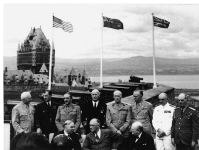
1943年：第1回ケベック会談